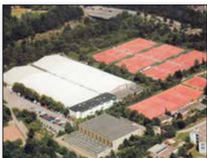
Leistungs- und Ausbildungszentrum Essen.

Der Verband Deutscher Tennislehrer VDT e.V. berät, betreut und bildet Sie mit staatlichem Abschluss aus.