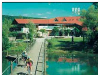
Leistungs- und Ausbildungszentrum Kelheim.

Der Verband Deutscher Tennislehrer VDT e.V. bildet aus: